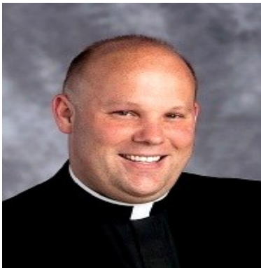
El Inmaculado Corazón de Nuestra Señora, P. Bjorn Lundberg

Que Dios te bendiga este verano y en este mes de julio y el mes de la Preciosa Sangre.